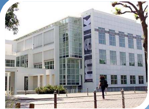
1. Museum für Angewandte Kunst