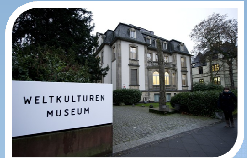
2. Museum der Weltkulturen